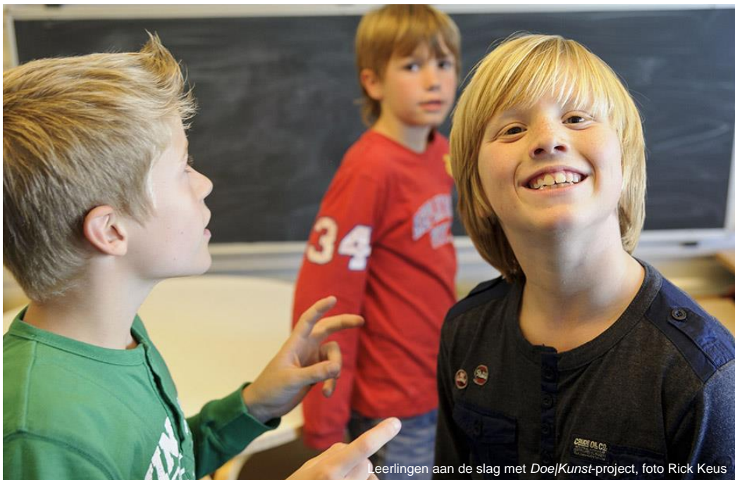
Leerlingen aan de slag met Doe/Kunst-project